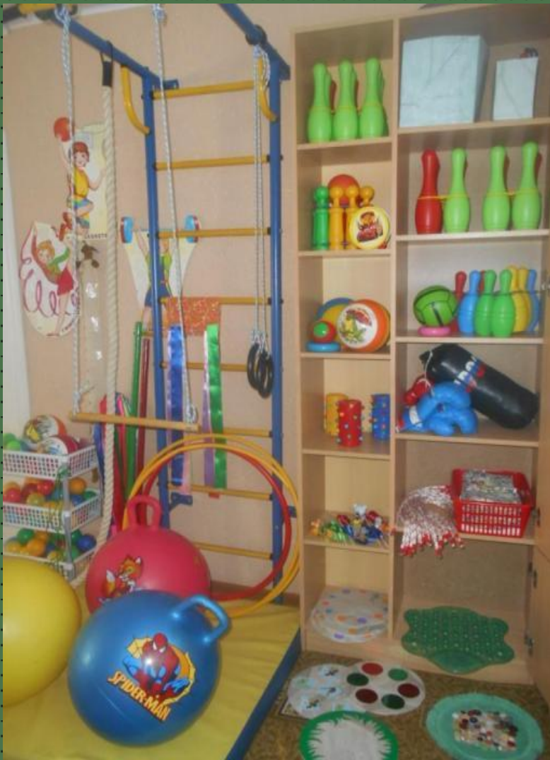
Центр физической культуры