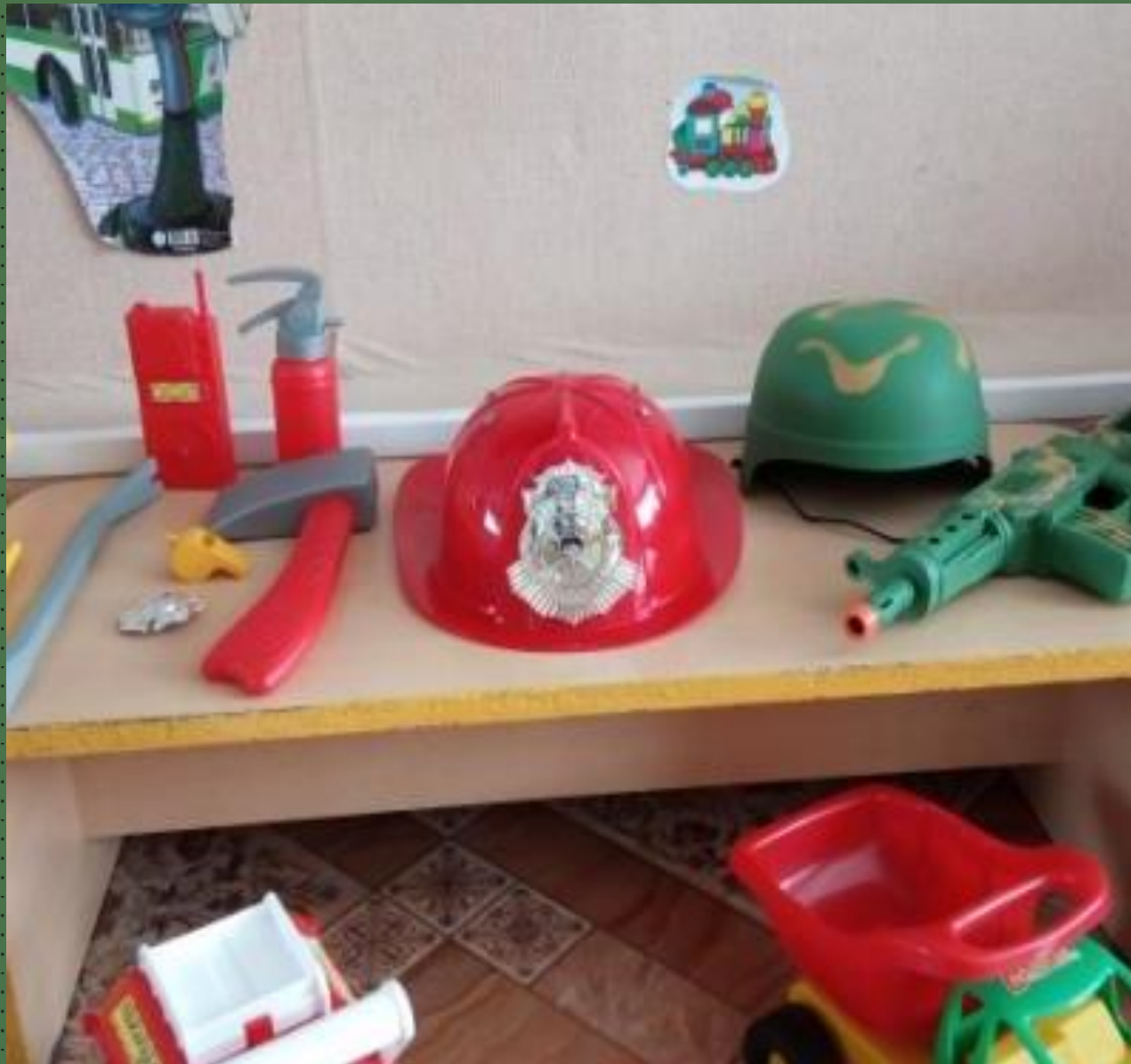
Модуль сюжетно – ролевая игра «Спасатели»