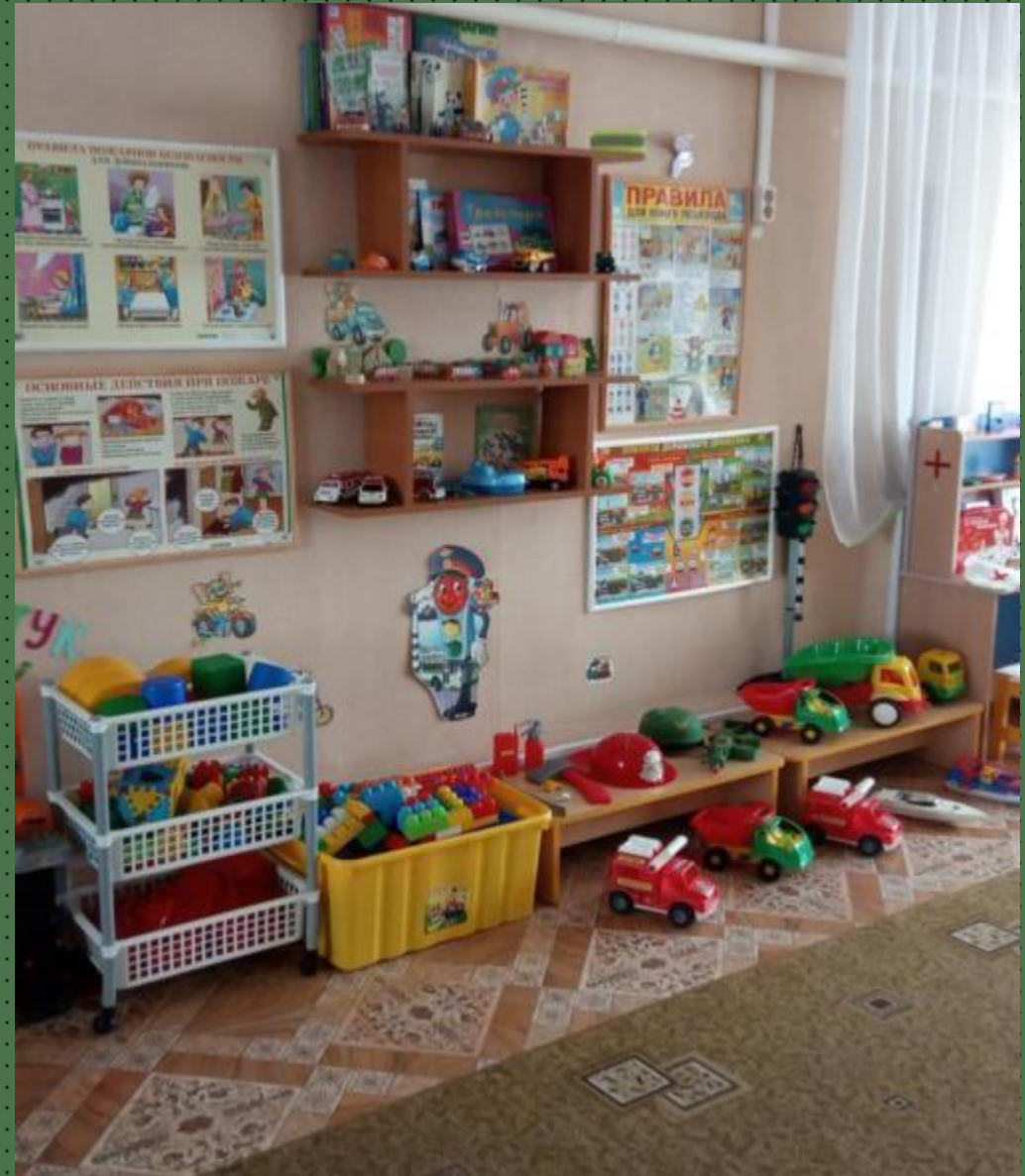
Модуль сюжетно-ролевых игр для мальчиков