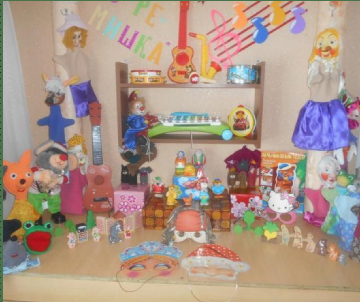
Музыкально-театральный центр «До - ре - мишка»