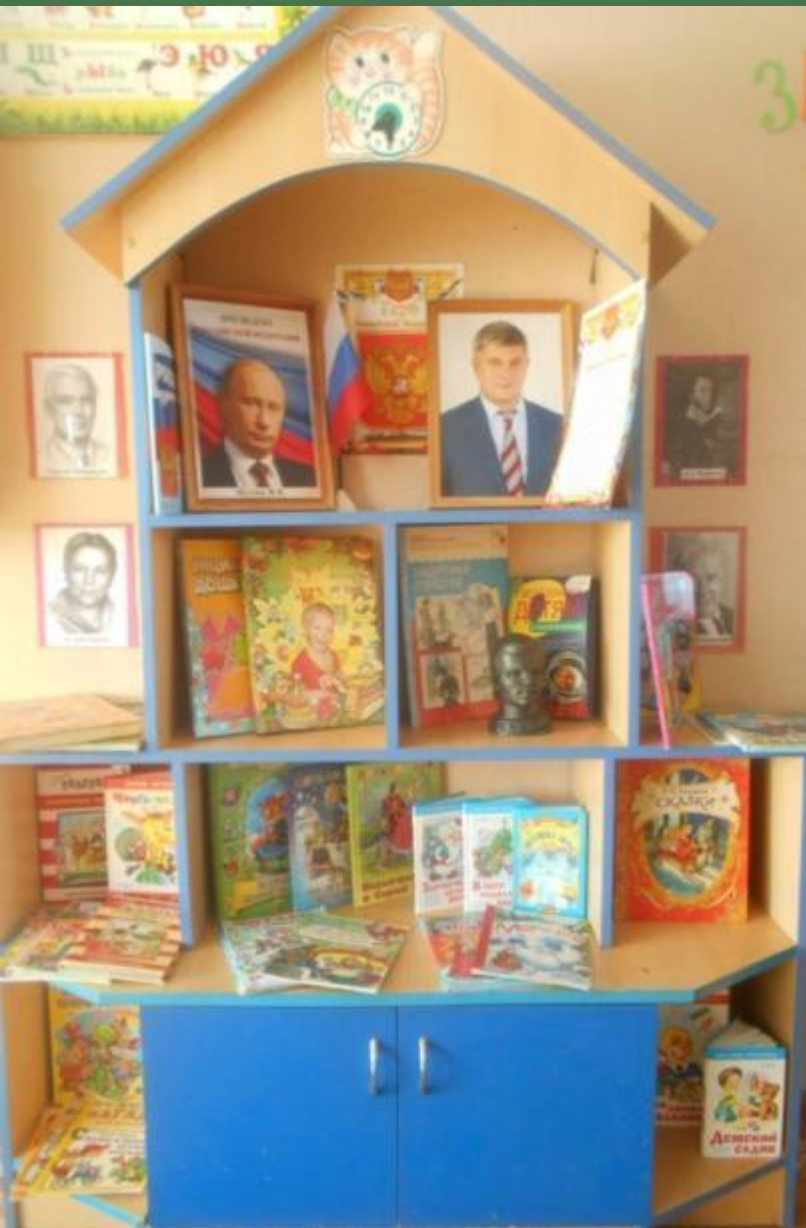
Книжно - патриотический центр