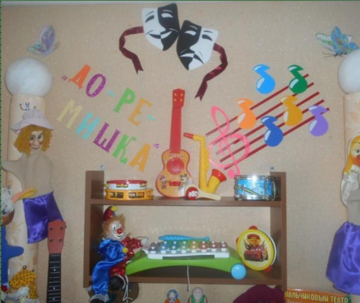
Музыкально-театральный центр «До - ре - мишка»