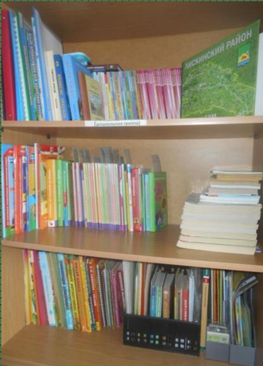
1.6. Рабочий сектор (методическая литература педагога)