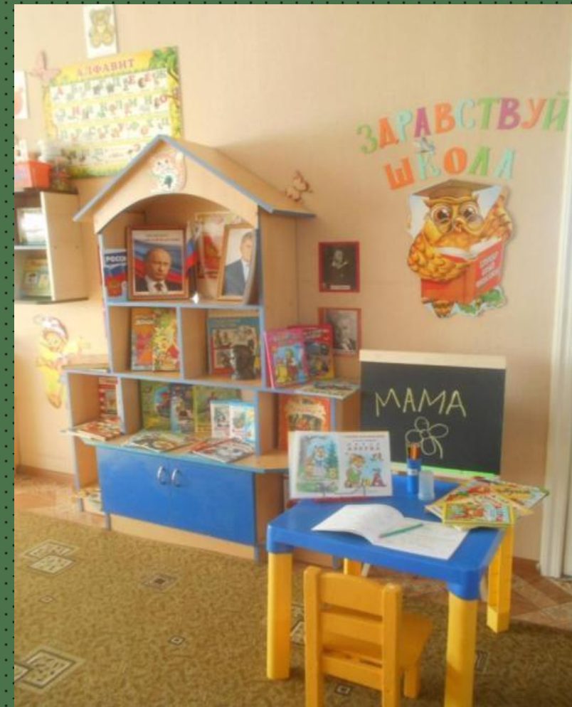
Центр «Здравствуй школа»