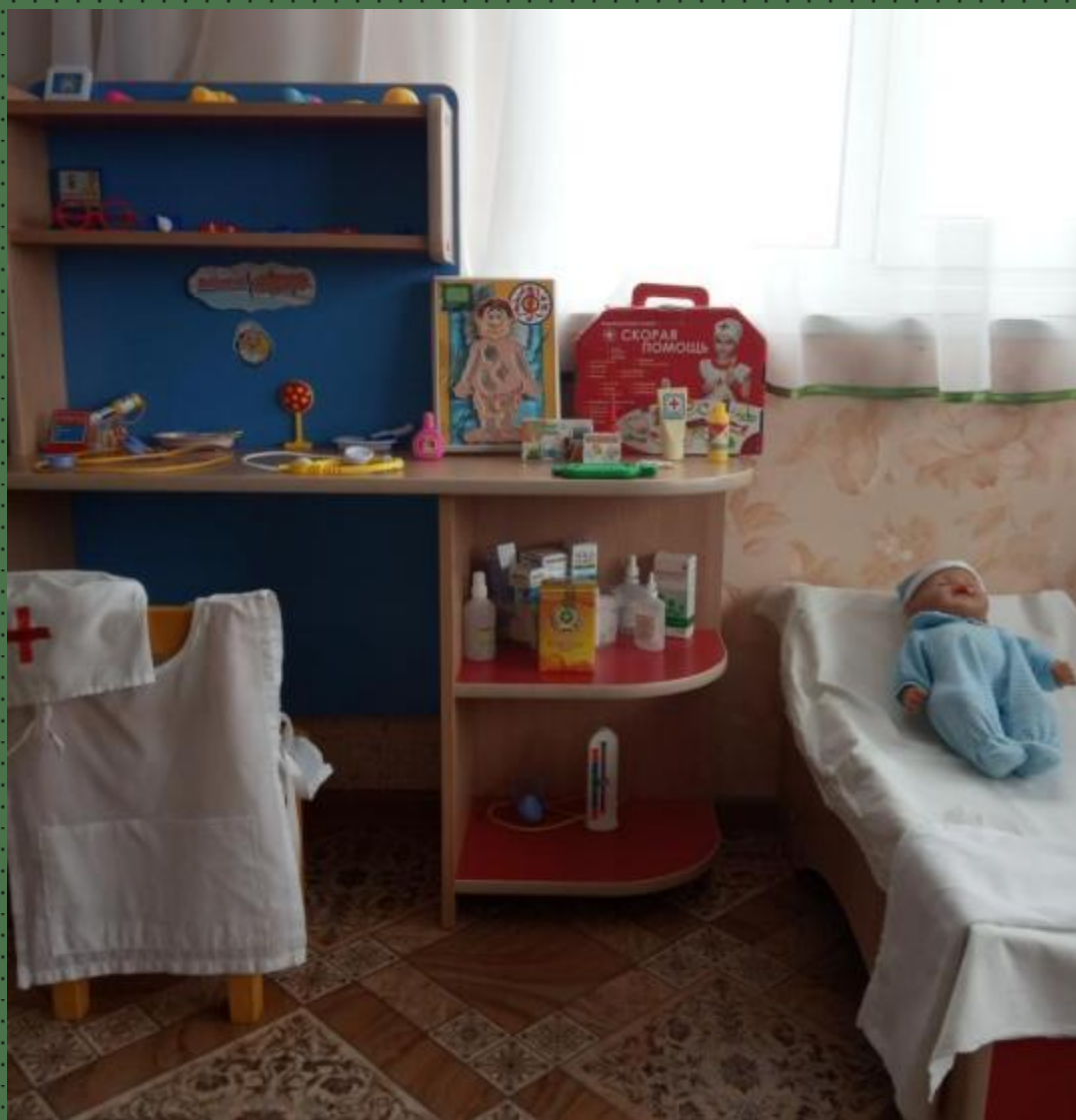
Модуль сюжетно-ролевой игры «Добрый доктор»