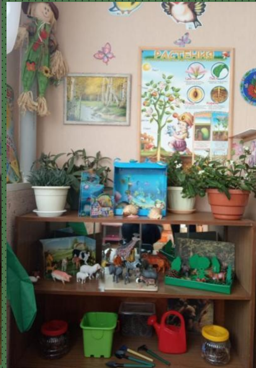
Центр живой и неживой природы