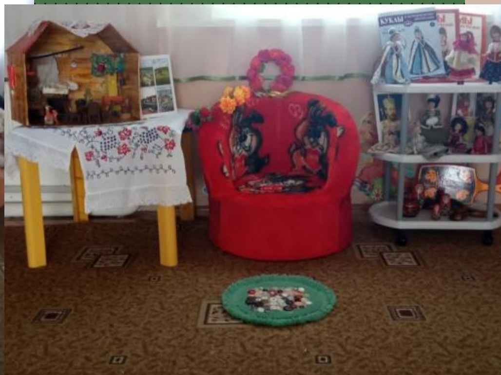
Центр «Наследие культуры»