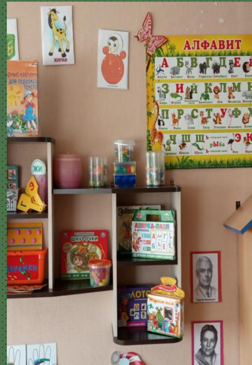
Центр развития речи «Раз словечко, два словечко»