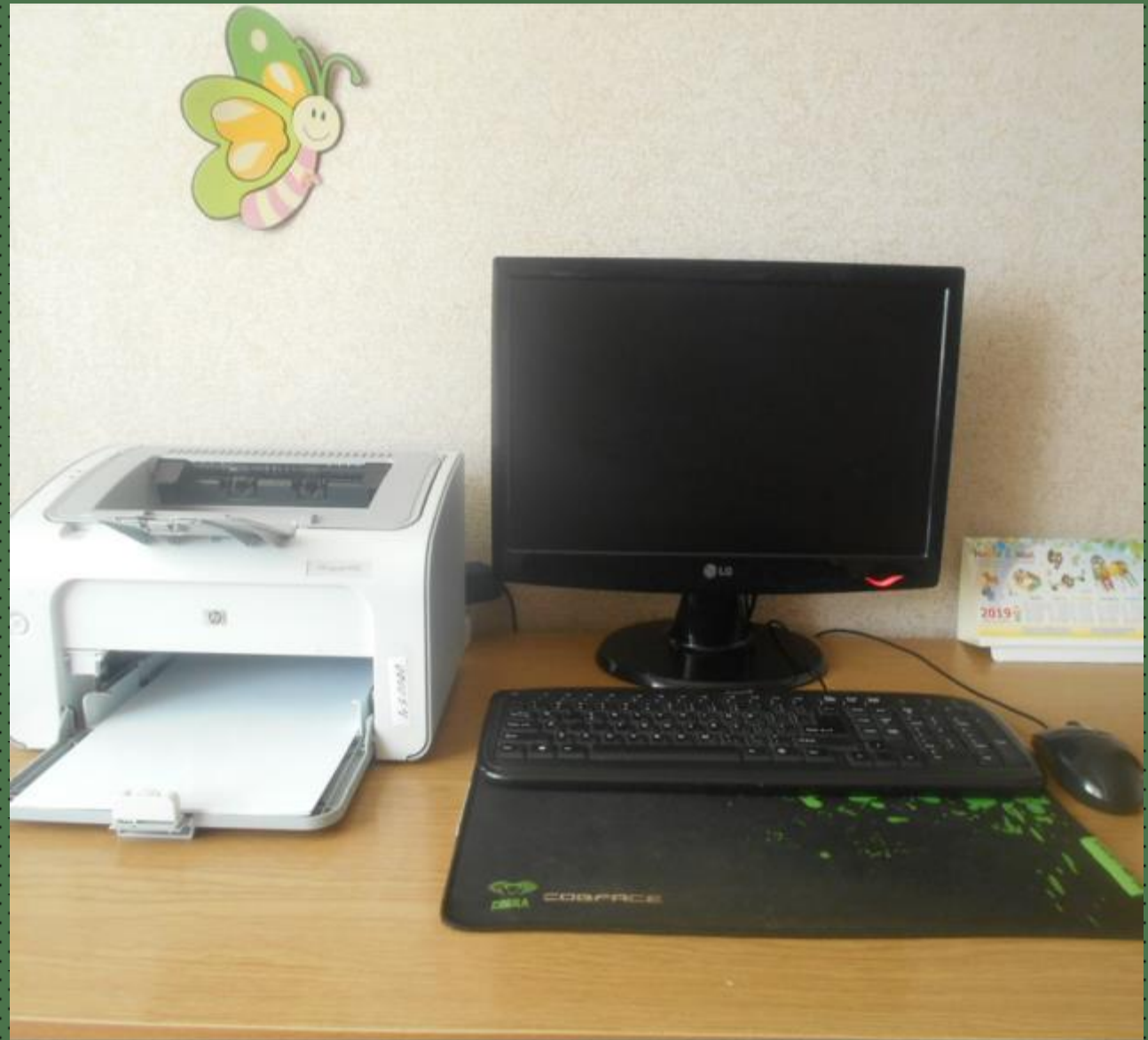
1.7. Рабочий сектор (ИКТ для педагога)