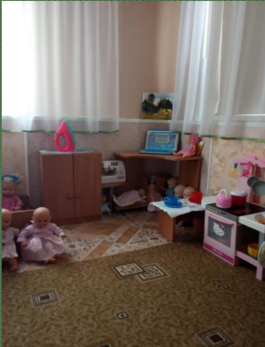
Модуль сюжетно-ролевой игры «Семья»