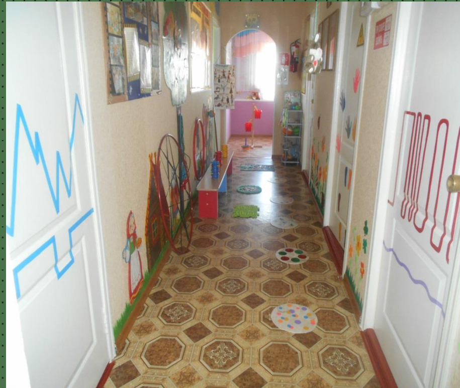
Центр двигательной активности в коридоре