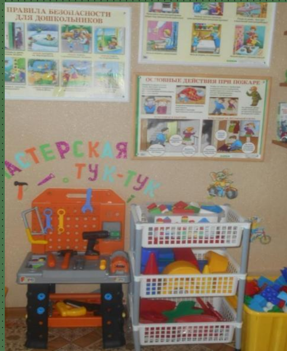
Модуль сюжетно-ролевой игры «Мастерская Тук-Тук»