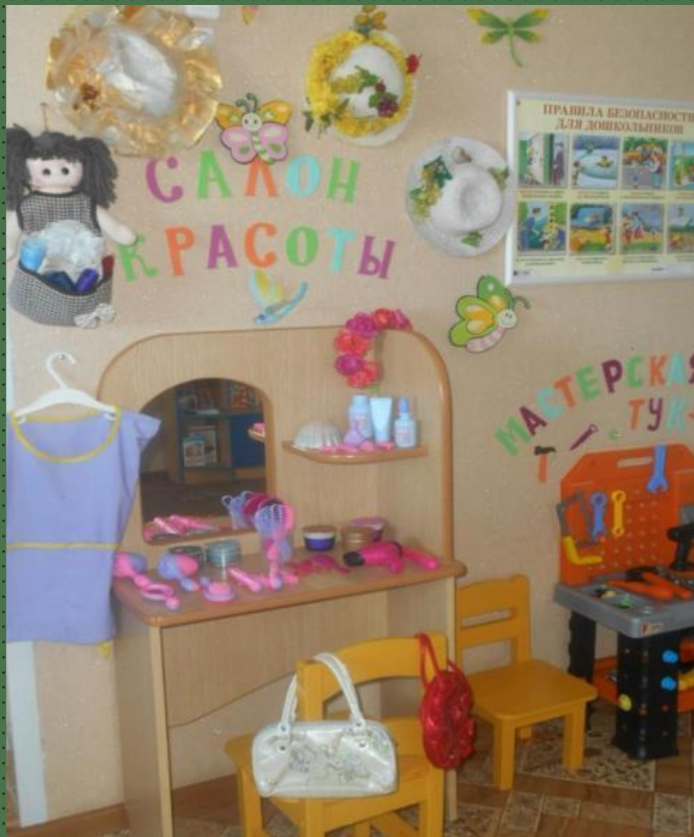
Модуль сюжетно-ролевой игры «Салон красоты»