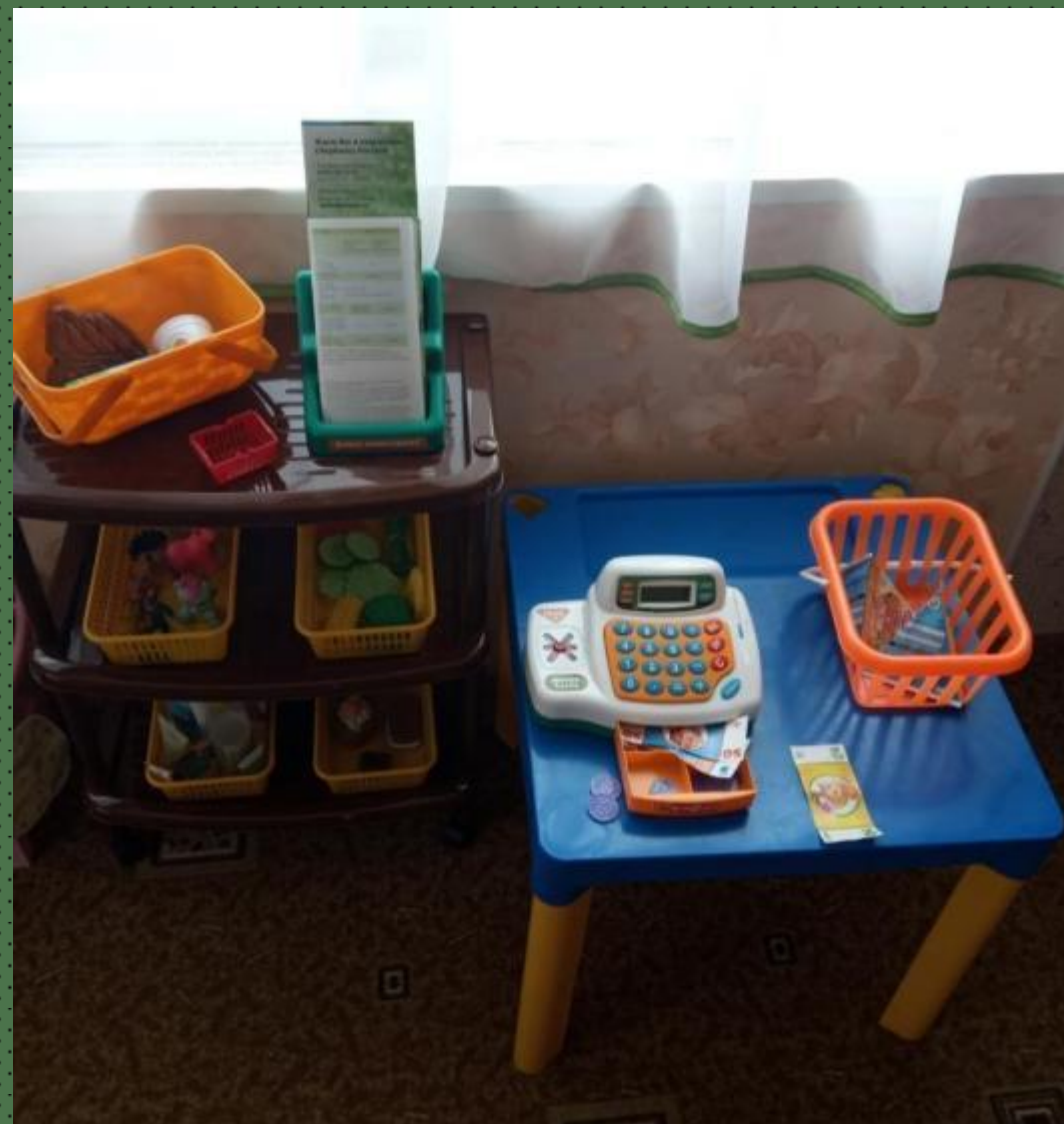
Модуль сюжетно-ролевой игры «Супермаркет»