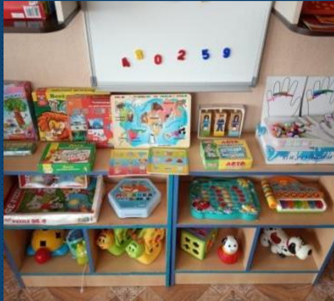
Модуль социализации и сенсорного развития