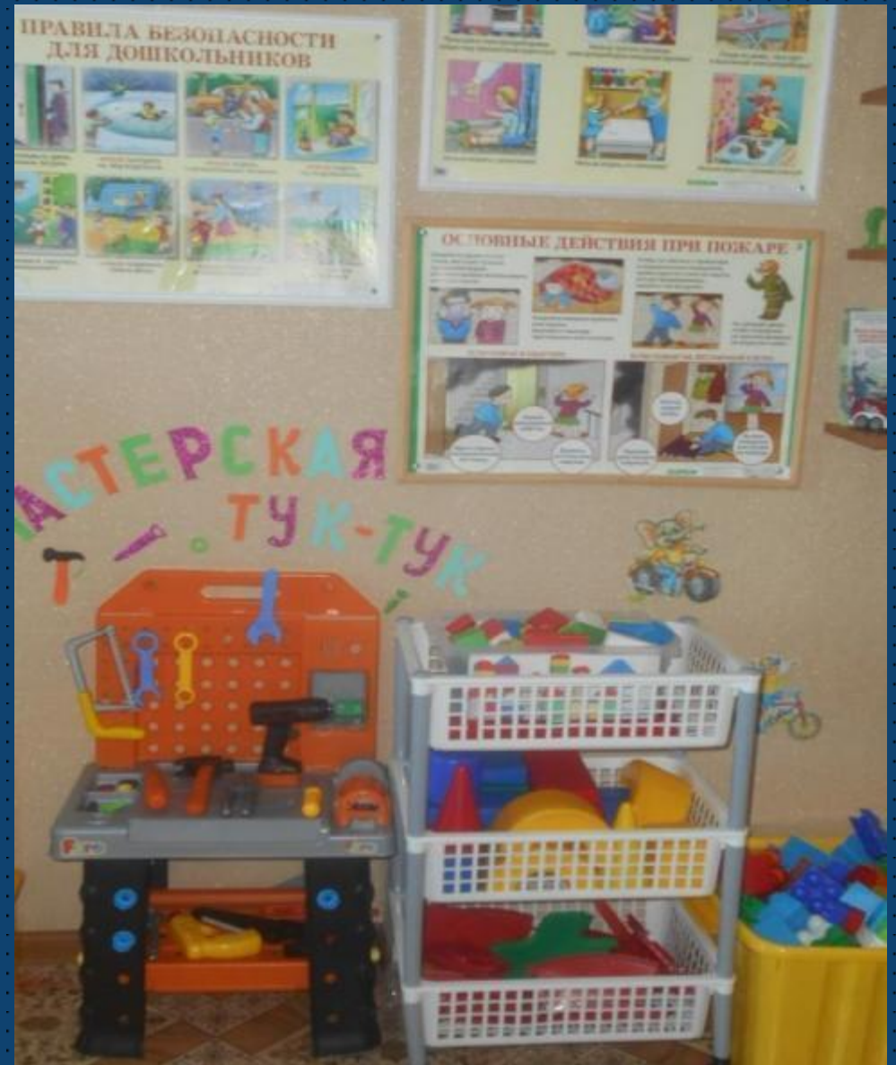
Модуль сюжетно-ролевой игры «Мастерская Тук-Тук»