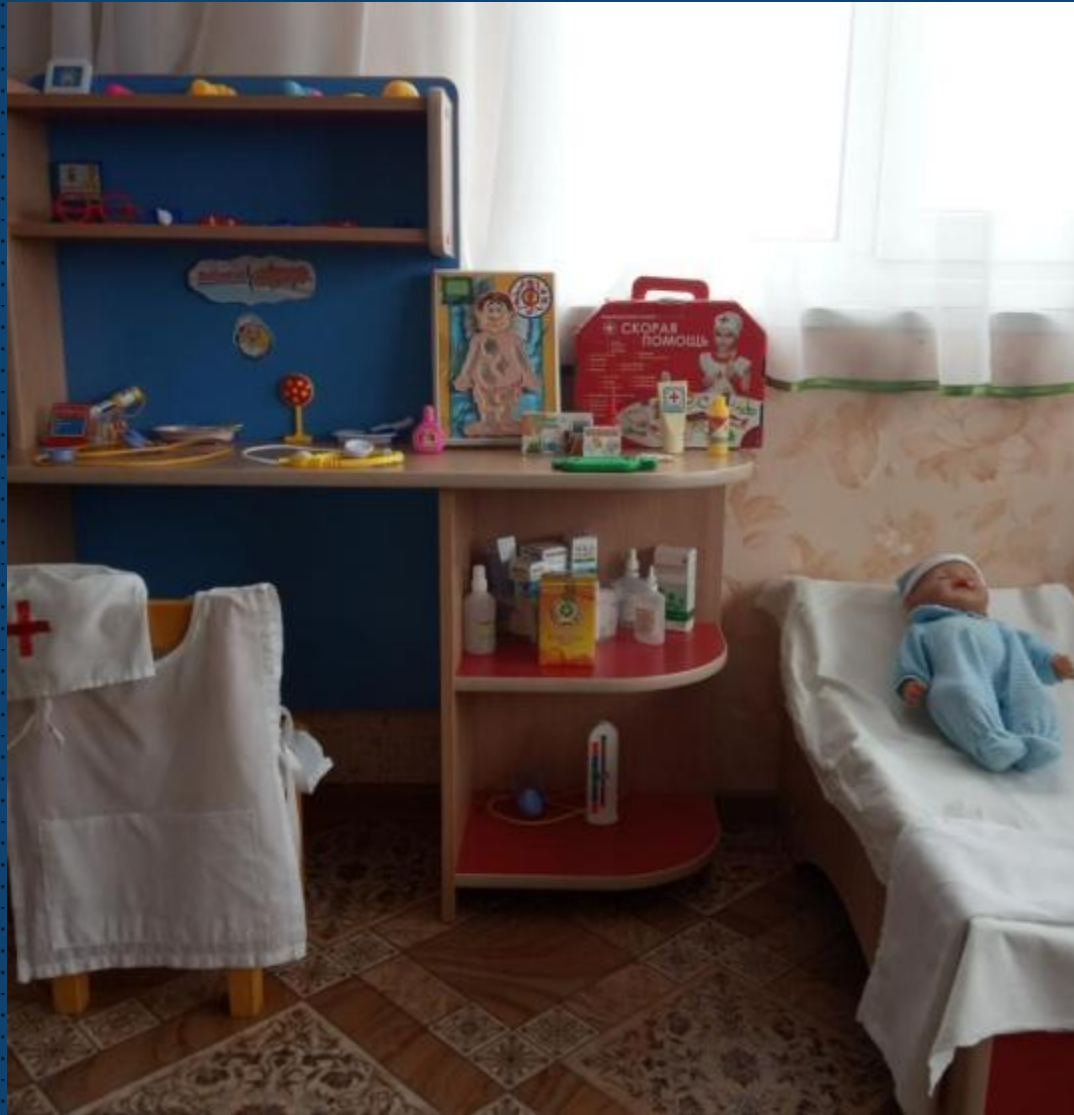
Модуль сюжетно-ролевой игры «Добрый доктор»