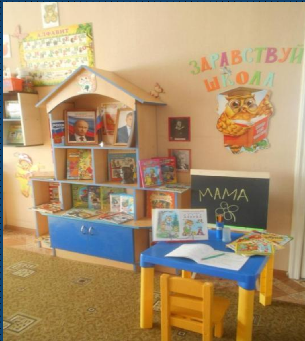
Центр «Здравствуй школа»