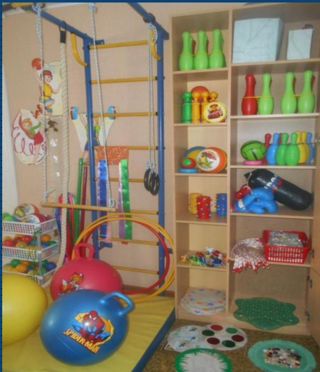
Центр физической культуры