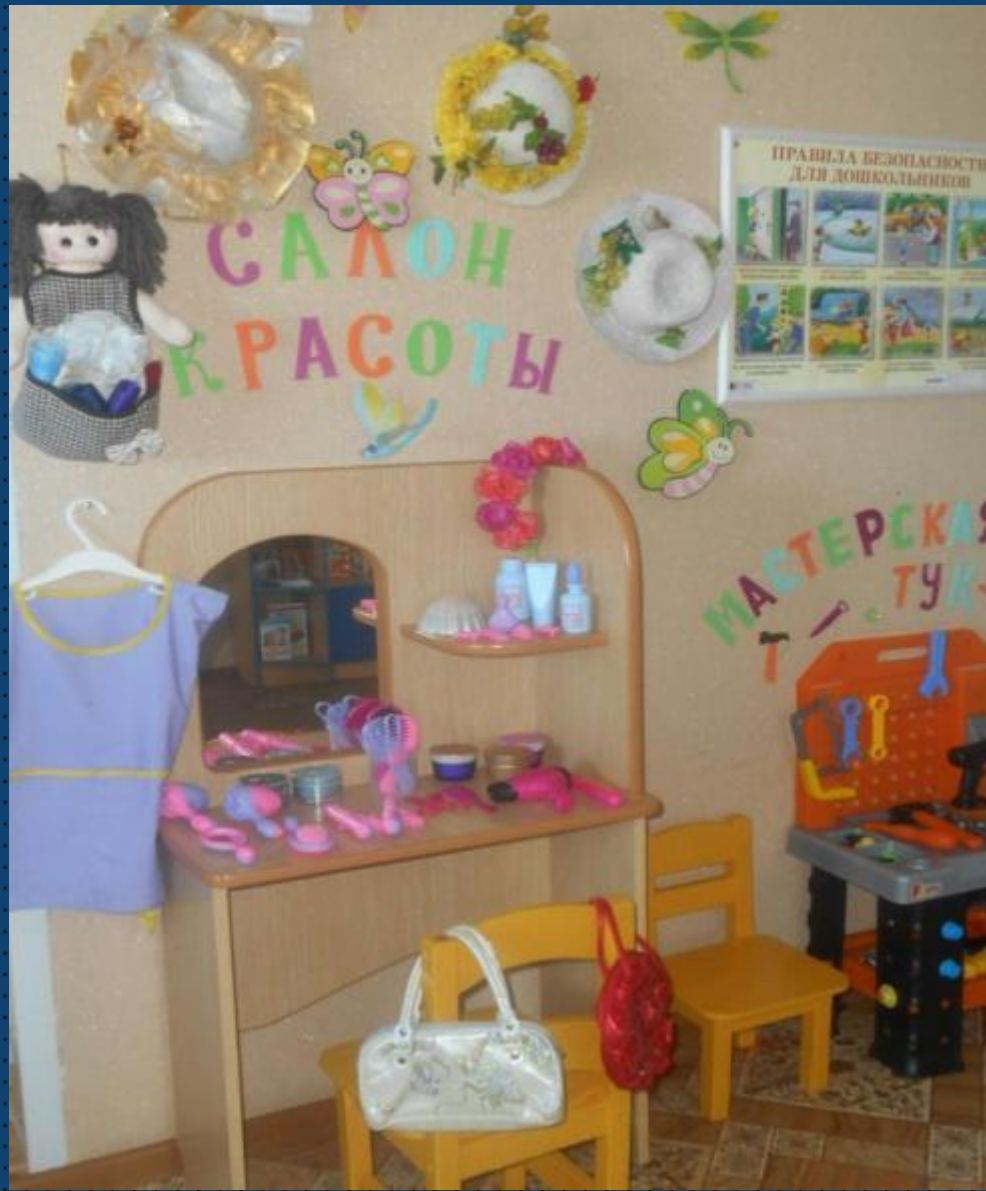
Модуль сюжетно-ролевой игры «Салон красоты»